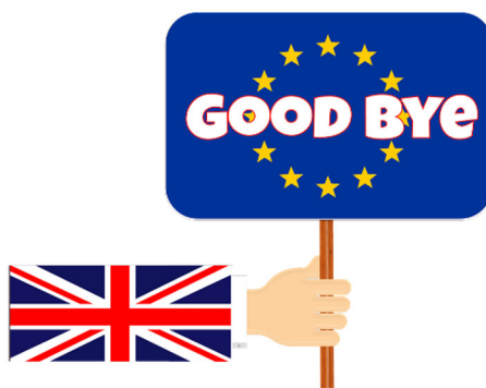
Imagen nº 1: Reino Unido, líder en euroescepticismo. Autor: InspiredImages Fuente: Pixabay . https://pixabay.com/en/brexit-eu-european-flag-britain-1505183/ Licencia: CC 1.0 Universal