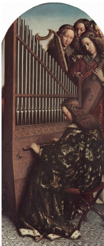
Imagen 2: Representación de un órgano de Hubert Van Eyck

El órgano es un instrumento de viento (acrófono), como lo son, por ejemplo, la flauta y la trompeta. El viento del órgano lo produce el FUELLE que está situado en la parte inferior del mueble. Antiguamente, se accionaba a mano mediante una palanca, pero hoy día se alimenta con ventiladores eléctricos. El viento producido en el fuelle pasa a una caja herméticamente cerrada que se llama SECRETO, en cuya tapa están encajados los TUBOS, de distinta longitud y diámetro, que producen los sonidos y que se ordenan en diferentes hileras (aunque existen órganos con una sola hilera de tubos). Por medio del teclado, el organista selecciona los tubos que deben sonar y cuáles deben permanecer en silencio.