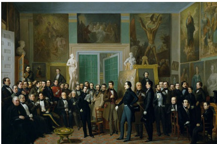
Imagen 5: Los poetas contemporáneos de Antonio María Esquivel.

c. Romanticismo tardío (1846-1868): terminada la corriente romántica y ya vigente la literatura realista, irrumpen algunos escritores, poetas sobre todo, que traen un romanticismo intimista.