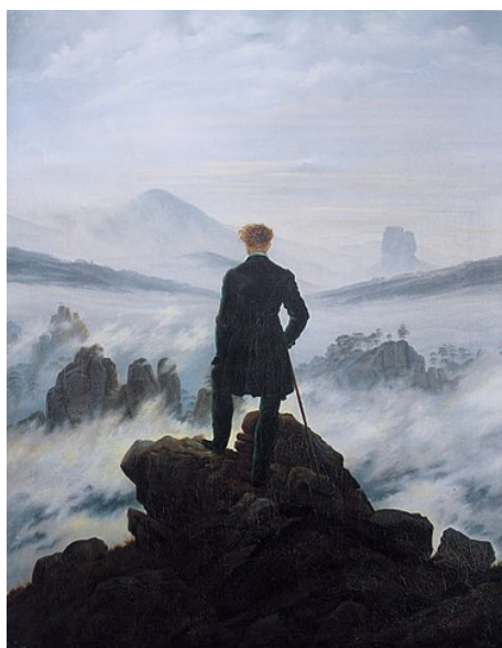
Imagen 1: Caminante sobre el mar de niebla de nubes de Caspar David Friedrich.

https://es.wikipedia.org/wiki/El_caminante_sobre_el_mar_de_nubes