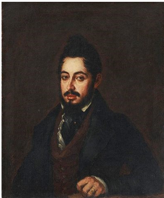
Imagen 6: Mariano José de Larra

Larra fue un eminente articulista, con una gran claridad y vigor en su prosa. En este terreno, sólo tiene como precedentes a Quevedo en el siglo XVII o a Feijoo, José Cadalso y Jovellanos en el XVIII. En sus artículos combate la organización del Estado, ataca al absolutismo y al carlismo, se burla de la sociedad, y rechaza la vida familiar. Los males de España, que identifica con la ignorancia, el atraso, la falta de educación y de cultura, son el tema central de su obra crítica y satírica. Descontento con el país y con sus hombres, escribe artículos críticos ( En este país, El castellano viejo, El día de difuntos de 1836, Vuelva usted mañana... ), contra la censura ( Lo que no se puede decir no se debe decir ), la pena capital ( Los barateros o El desafío y la pena de muerte ), contra el pretendiente carlista ( ¿Qué hace en Portugal su majestad? ) y el carlismo ( Nadie pase sin hablar al portero ), contra el uso incorrecto del lenguaje ( Por ahora, Cuasi, Las palabras ), etc. También cultivó la novela histórica ( El doncel de don Enrique el Doliente ) y la tragedia ( Macías )