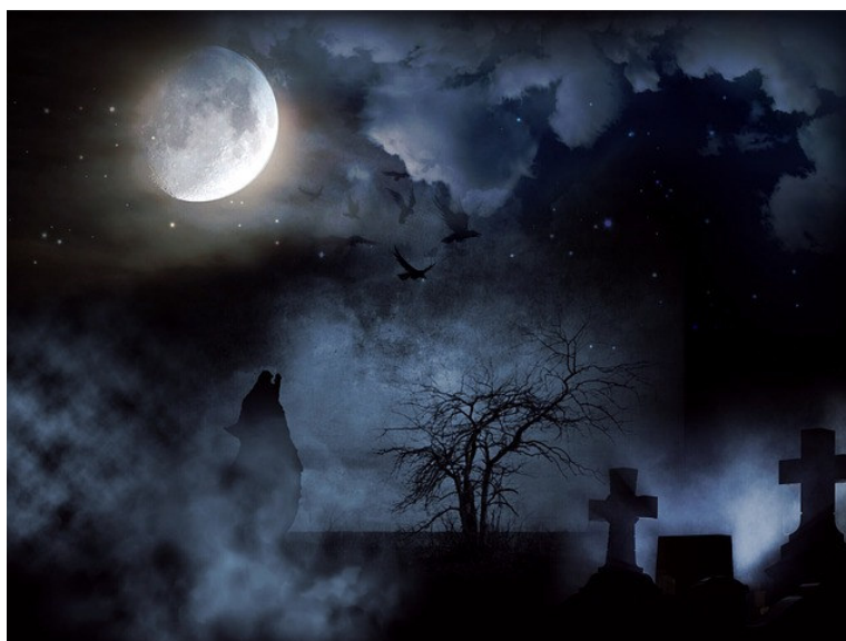
Imagen 4: Cementerio Fuente: Pixabay Licencia: Creative Commons

3. Presencia de lo sobrenatural. Unas veces se manifiesta como el poder terrible de Dios –así lo vemos en el mito de don Juan Tenorio–, y otras como ingrediente macabro. Lo cierto es que la presencia del más allá, de los muertos que vuelven a la vida se convierte en un rasgo más del estilo romántico. Un ejemplo muy conocido de la presencia de lo sobrenatural es la leyenda “El monte de las ánimas” de Bécquer o la misteriosa mujer de “El estudiante de Salamanca” que resulta ser el espectro de la antigua amante del protagonista.