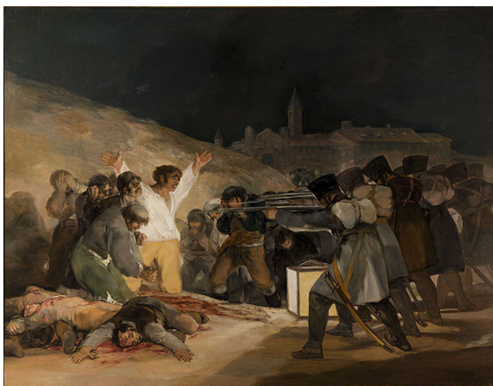
Imagen 2: El tres de mayo de Francisco de Goya

La Europa de la primera mitad del siglo XIX experimenta una serie de transformaciones como consecuencia de la Revolución Francesa. De estas transformaciones surge un nuevo tipo de sociedad (cada vez menos rural y más urbana e industrializada), nuevas clases sociales como la burguesía o el proletariado, y nuevas ideologías políticas (socialismo, liberalismo, nacionalismo). España participa de todos estos cambios aunque, frente a otras naciones europeas, su situación político-social se caracteriza más bien por su inmovilismo, su atraso y la falta de libertad, en especial durante la época absolutista de Fernando VII. Pero también España conoció períodos de lucha en defensa de una sociedad liberal (la que representa la Constitución de Cádiz de 1812), o de la nación contra la ocupación francesa (la Guerra de Independencia de 1808). De todo ello es testigo y testimonio Francisco de Goya. Mira este documento sobre el dos de mayo y el video de la Restauración para situarte bien en el contexto histórico.