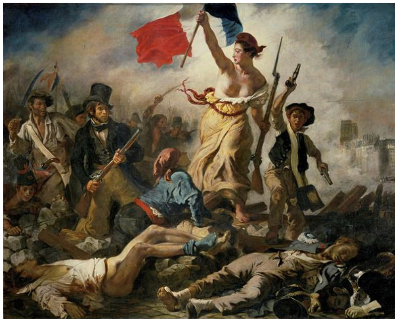
Imagen 3: La libertad guiando al pueblo de Eugène Delacroix Fuente: Wikipedia Licencia: Dominio Público.

https://es.wikipedia.org/wiki/Siglo_XIX#/media/File:Eug%C3%A9ne_Delacroix_-_Le_28_Juillet,_La_Libert%C3%A9_guidant_le_peuple.jpg