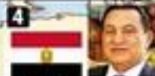
4 Hosni Mubarak, jefe de Estado de Egipto. En el poder hace 30 años.