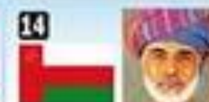
14 Sultán Qaboos ibn Sa'id Al 'Bu Sa'id, Omán. Gobierna hace 41 años.