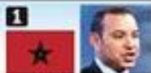
1 Roy Mohamed VI, Marruecos. Su familia gobierna hace 54 años.