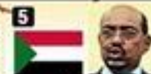
5 Omar Hasan Ahmad al-Bashir, Sudán. Dictador hace 22 años.