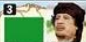
3 Muamar Kadafi, Libia. Es dictador hace 42 años.