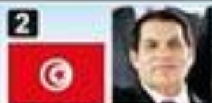
2 Ben Ali, Túnez. Derrocado. Gobernó por 23 años.