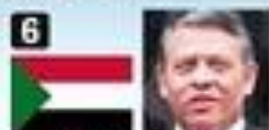
6 Roy Abdalá II, Jordania. Monarca hace 11 años.