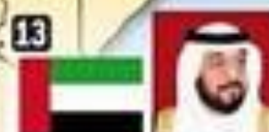
13 Emir Khalifa bin Zayed Al Nahayan, Emiratos Arabes. Su familia gobierna hace 40 años.