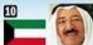
10 Sabah Al-Ahmad, Kuwait. Monarquía hace 50 años.