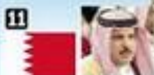
11 Hamad ibn Isa Al Khalifah, Barein. Su familia gobierna hace 50 años.