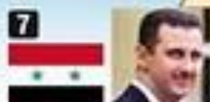
7 Bashar al Assad, Siria. Su familia gobierna hace 40 años.