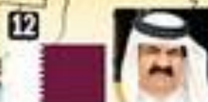
12 Hamad bin Jalifa Al Thani, Quatar. Emir hace 34 años.