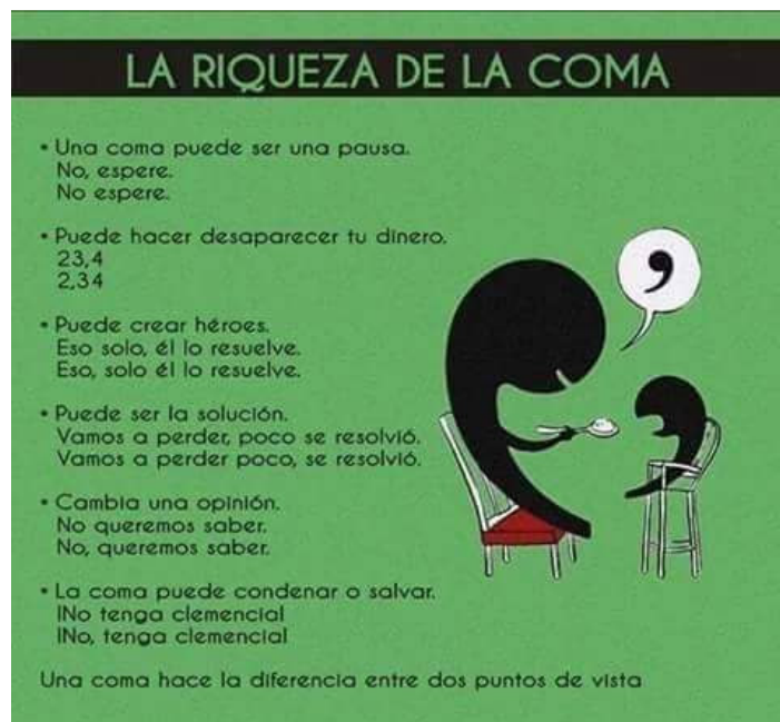
Imagen nº 3: La riqueza de la coma. Autor: desconocido.

Fuente: blogspot.com . Licencia: desconocida.